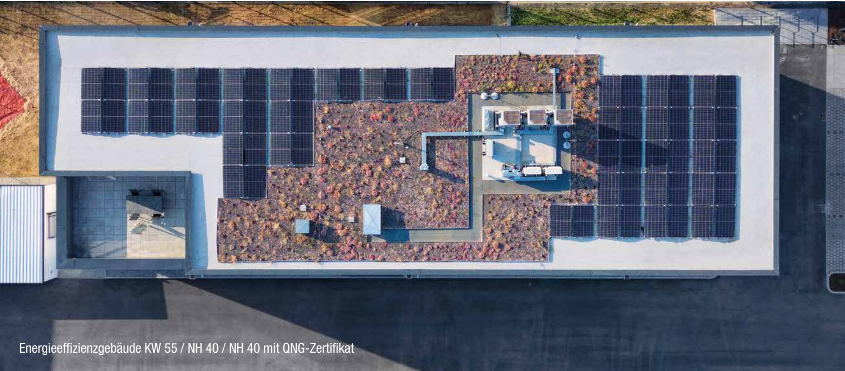
Energieeffizienzgebäude KW 55 / NH 40 / NH 40 mit QNG-Zertifikat