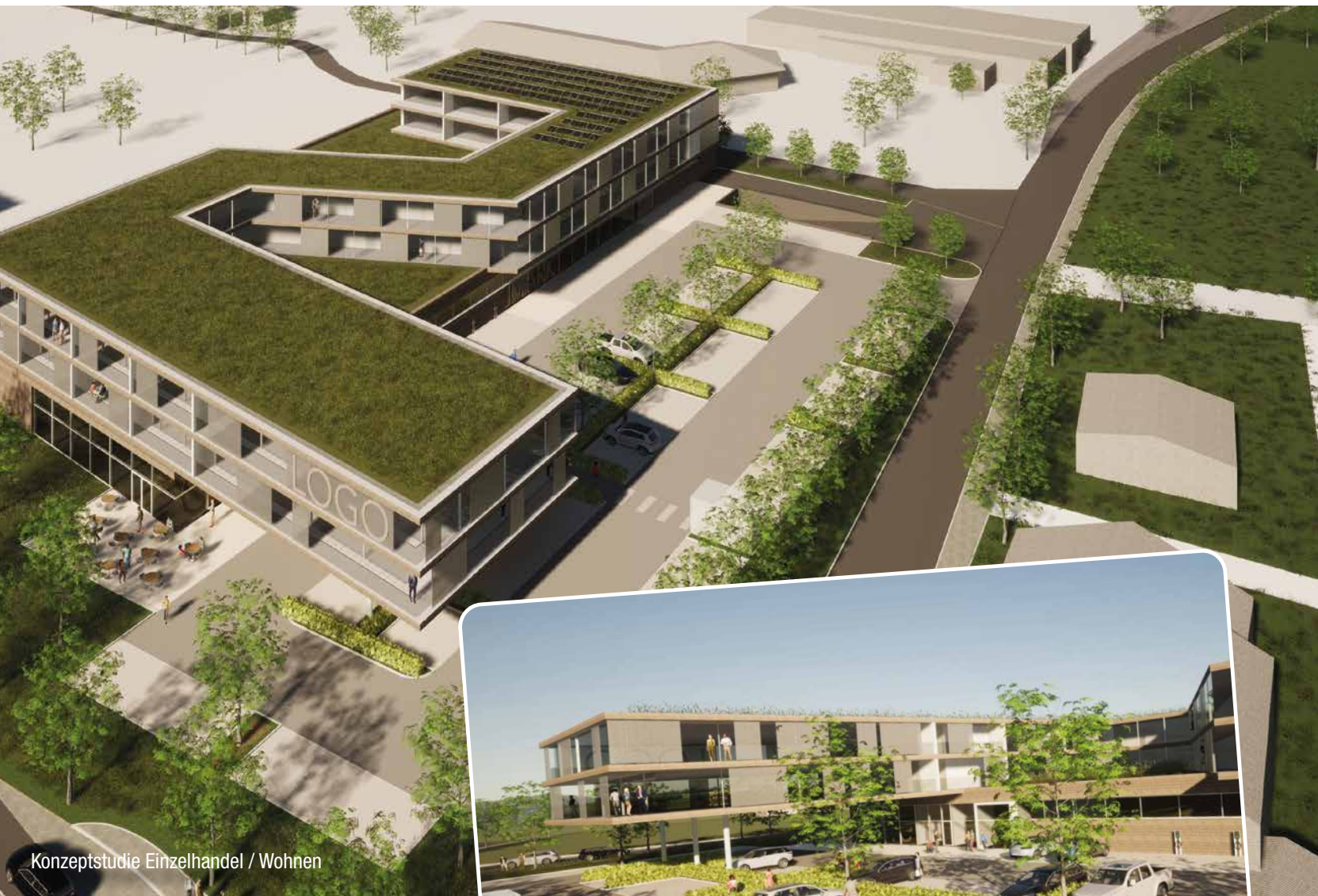
Konzeptstudie Einzelhandel / Wohnen