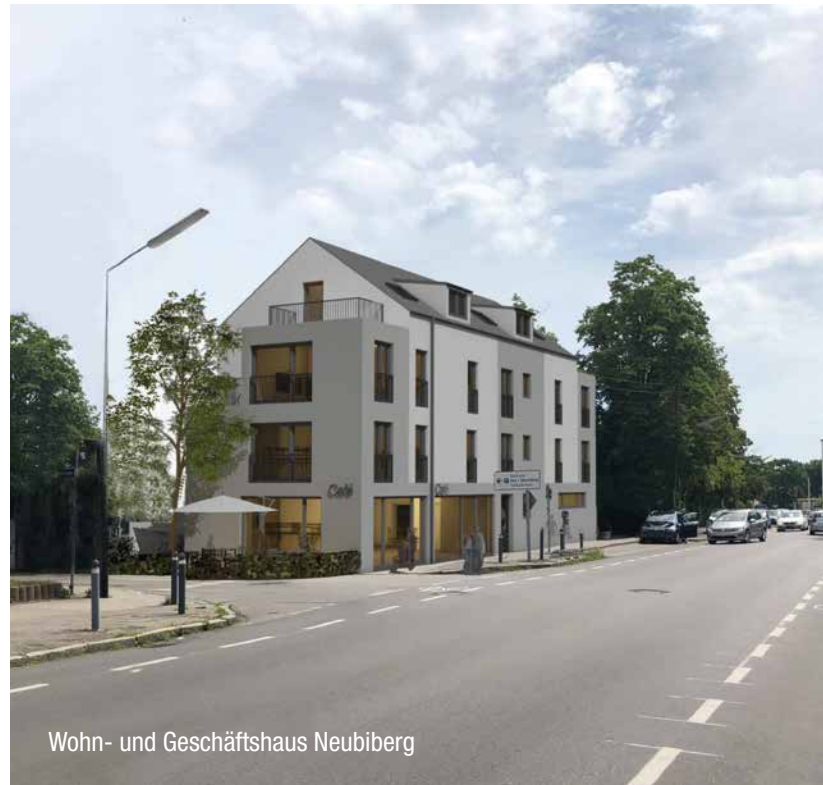
Wohn- und Geschäftshaus Neubiberg

WirtschaftsWoche HÖCHSTES Kunden- vertrauen 2022 Sparkassen- Finanzgruppe/LBS